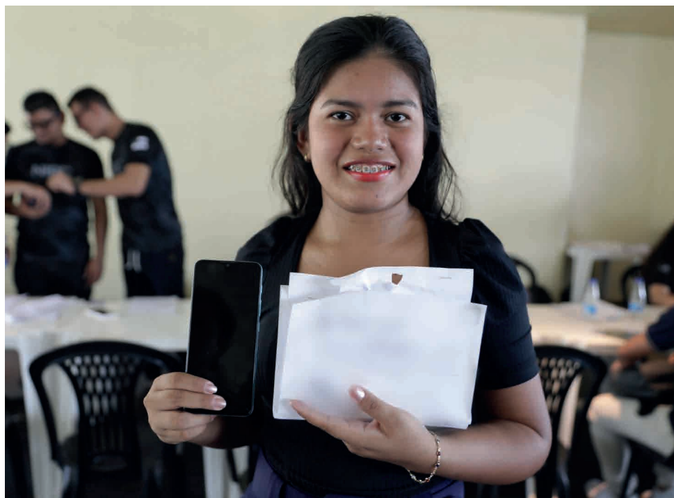
Devolução de 250 aparelhos, de 500 que foram resgatados, é resultado de 40 dias de trabalho do Núcleo de Investigação e Recuperação de Celulares