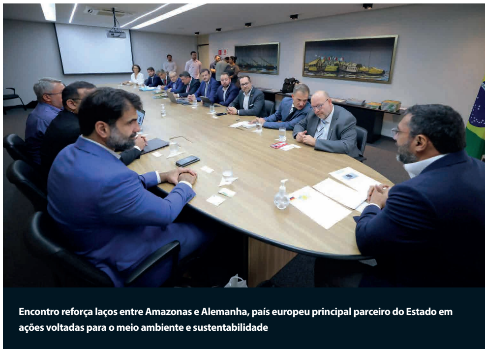
Encontro reforça laços entre Amazonas e Alemanha, país europeu principal parceiro do Estado em ações voltadas para o meio ambiente e sustentabilidade